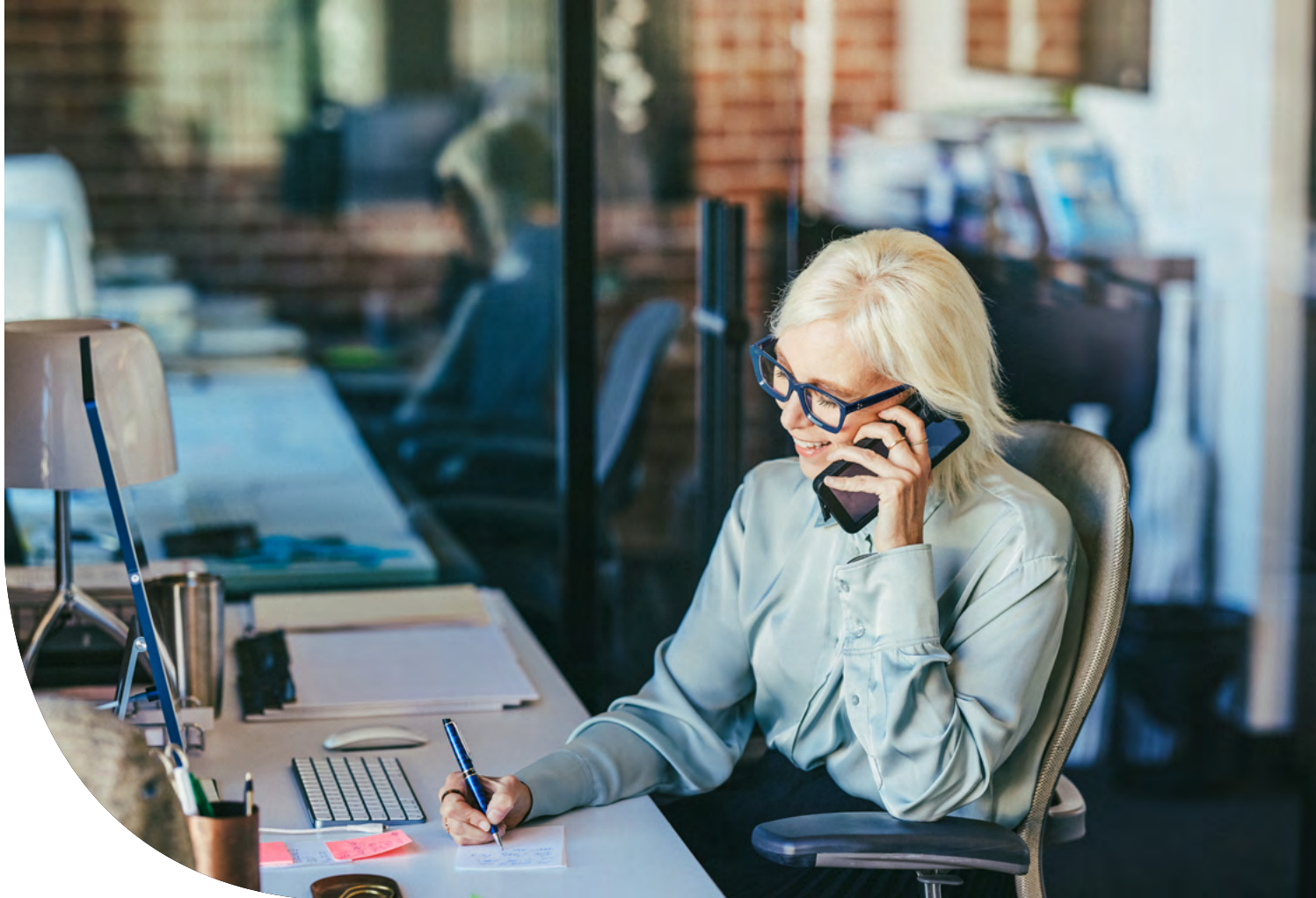
Tabela de Suporte